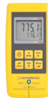
Handmessgeräte zur Temperaturerfassung