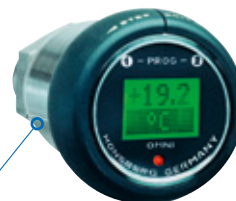
Temperatur-Transmitter und -Schalter