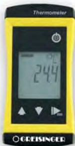
pH metr G 1500 a kompaktní teploměr G 1700