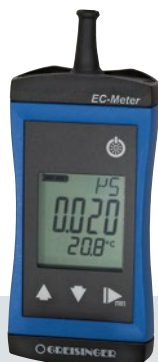
G 1000 Serie

Zu Beginn der Messung empfiehlt es sich, durch Tastendruck, eine Kalibrierung an der Luft vorzunehmen.