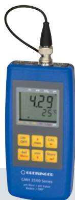
GMH 3000 Serie