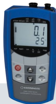
GMH 5000 Serie